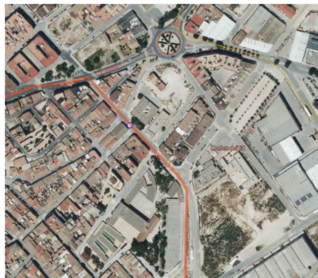
Retall del visor de l'ICV de la GVA. Recorte del visor del ICV de la GVA.

Donat l'objecte de la modificació, no es preveu l'adopció de mesures de seguiment ambiental del pla.