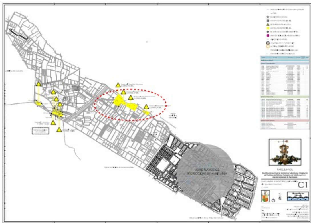
Plano de Localización de BRL y sus entornos ○ Ámbito afectado por riesgo de inundabilidad

Se cataloga la vía pecuaria Vereda de Segorbe como elemento de interés arqueológico con grado de protección integral; no obstante, en la ficha no se indica la calificación del suelo ni se menciona en el apartado de normativa de protección la relativa a vías pecuarias.