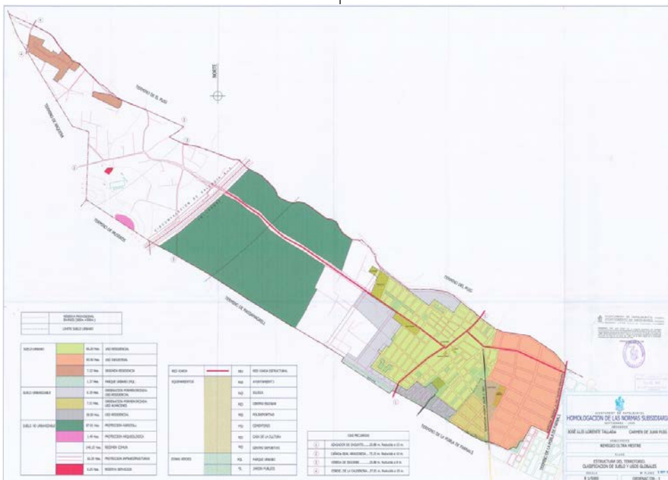
Annex I – Imatges

1. Con carácter general, en las fichas se incluirán las siguientes informaciones: